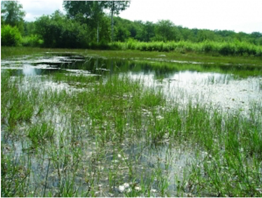
Mare de Coquibus